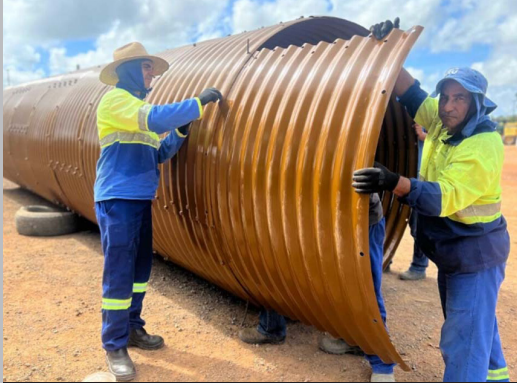
Uma das equipes da Seminsp realiza a montagem de 25 tubos arcos

(Da Redação) -prefeito Jeverson Lima (MDB), com o objetivo de manter as vias urbanas e rurais sempre em boas condições de tráfego, a Secretaria Municipal de Infraestrutura e Serviços Públicos (Seminsp) tem realizado a substituição de pontes de madeira, por material mais resistente.