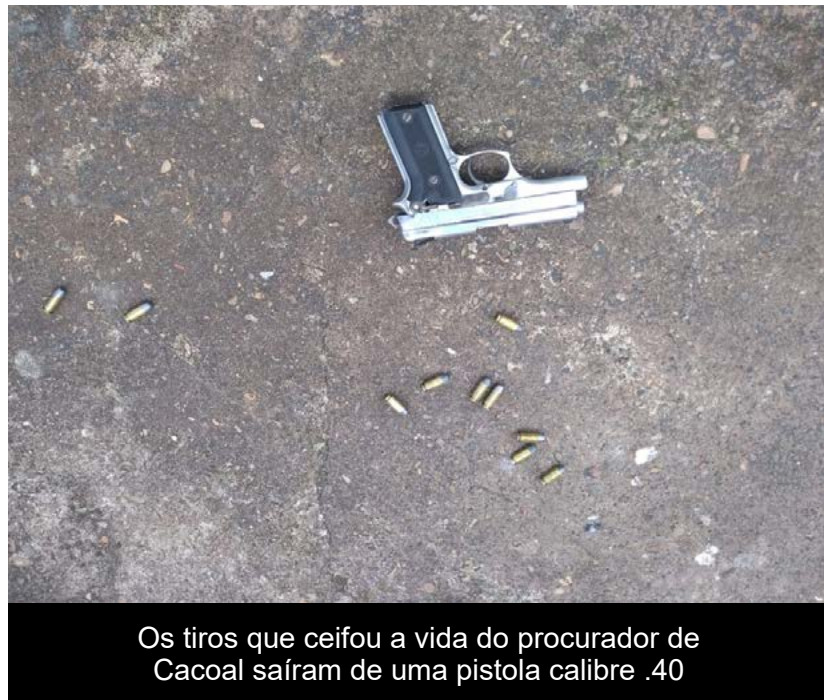
Os tiros que ceifou a vida do procurador de Cacoal saíram de uma pistola calibre .40