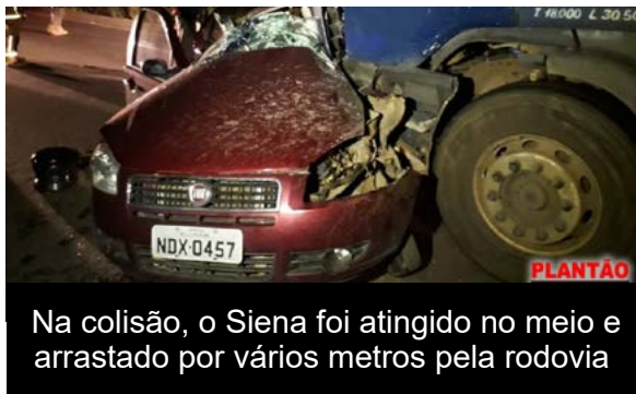
Na colisão, o Siena foi atingido no meio e arrastado por vários metros pela rodovia

Mais um acidente com vítimas fatais foi registrado na BR-364, na quinta-feira (13). Nele, três pessoas morreram após a colisão entre uma carreta e um veículo Siena. O acidente aconteceu por volta das 23h no km 26 da rodovia federal perto da ponte do rio Leitão em Presidente Médici.