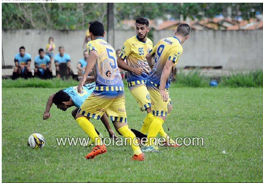
Ainda invicto no campeonato, o Juventude de Cacoal terá prova difícil diante do JM Gesso/Capelasso

(Chico Limeira)Cercado de grandes expectativas, o fim de semana será de muitas emoções com a realização dos jogos de ida da fase quartas de final da Taça Inverno Airton Gurgacz 2018 de futebol de câmpo.