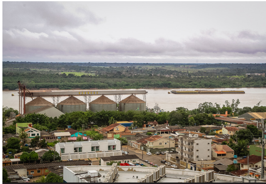
Porto Público de Porto Velho movimentou em 2017 cerca de R$ 2,5 milhões em cargas, principalmente soja e milho

(Da Redação) O complexo portuário de Porto Velho movimentou em 2017 aproximadamente R$ 14 milhões em cargas, principalmente grãos e derivados de petróleo, segundo a Federação Nacional das Empresas de Navegação Aquaviária (Fenavega). Dos 18 portos da capital, foi no Porto Público que ocorreu a maior movimentação: cerca de R$ 2,5 milhões em cargas, aproximadamente 85% grãos. Também é expressiva a circulação de carnes e madeiras.