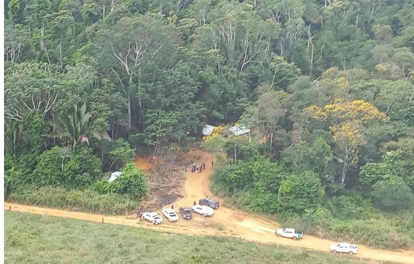
Por intermédio do uso de uma aeronave, os policiais encontraram uma grande área desmatada

(Da Redação) A Polícia Militar (PM) retirou invasores de uma propriedade rural na região da Floresta Nacional (Flona) do Bom Futuro, em Alto Paraíso, durante uma operação realizada na quinta-feira (1º). Agentes identificaram que o local funcionava como ponto de apoio para invasão à Unidade de Conservação.