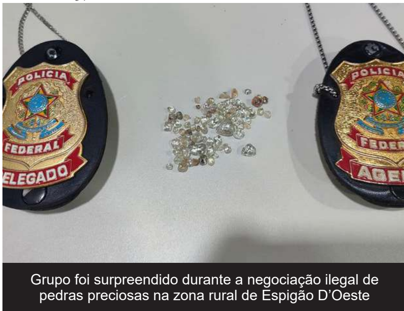
Grupo foi surpreendido durante a negociação ilegal de pedras preciosas na zona rural de Espigão D'Oeste

(Da Redação) A Polícia Federal (PF) prendeu quatro pessoas em flagrante, durante ação de inteligência que identificou uma negociação clandestina de diamantes na zona rural do município de Espigão D'Oeste.