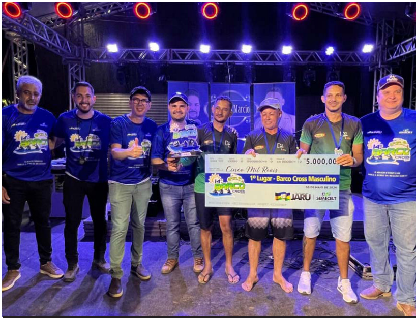
Evento que aconteceu no último fim de semana reuniu milhares de pessoas

(Da Redação) A Prefeitura de Jarú, por meio da Secretaria Municipal de Esportes, Cultura, Lazer e Turismo (Semecelt), promoveu no último fim de semana o 14º Barco Cross.